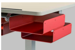
Ablagefach klein THAF