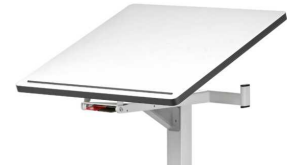
Schrägstellung mit Gasfeder THSS

VERSTELLBARER PC-HALTER MIT 2 GURTEN, 2 CM RASTERUNG, MONTAGE AN MAPPENHAKEN