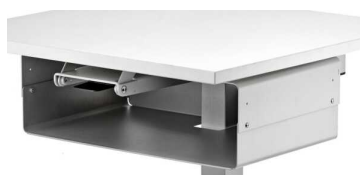
Ablagefach gross THAFG

GROSSES ABLAGEFACH, 2-STUFIG HÖHENVERSTELLBAR